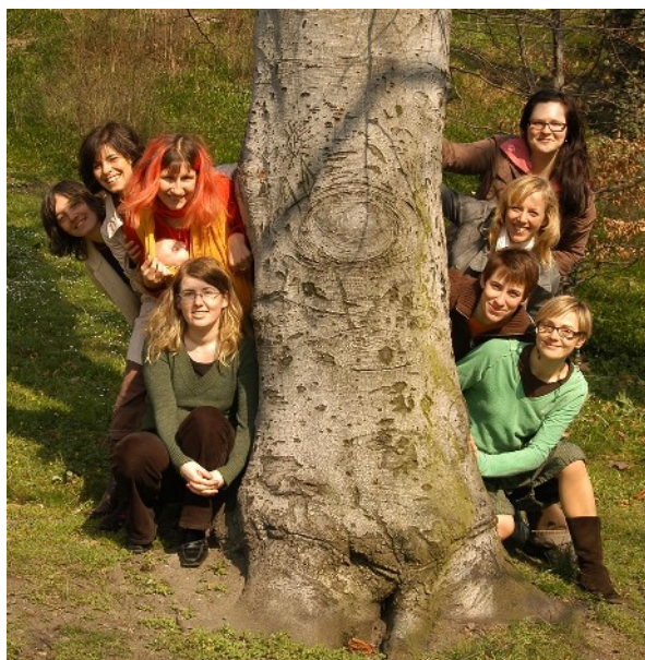
Fórum 50 %, jaro 2007