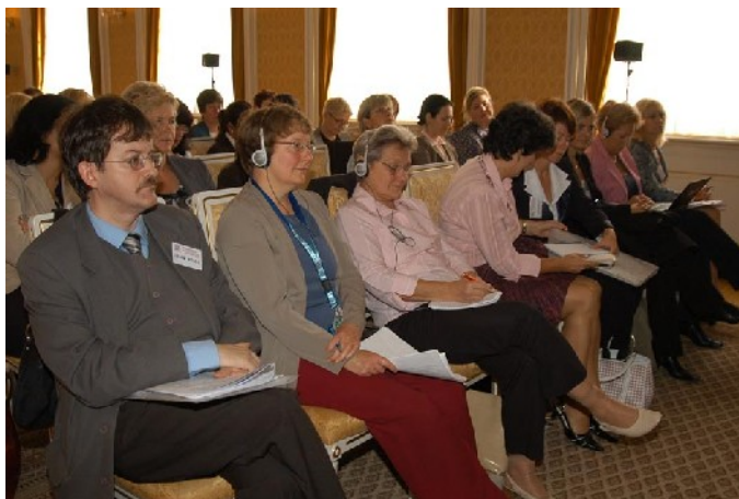
Konference "Podpora žen ve vstupu do politiky: možnosti uplatnění pozitivních nástrojů"

Aktivity: Uspořádaly jsme konferenci s účastí zahraničních politiků a politiků a odbornic na problematiku kvót . V panelu zasedli i zástupci českých parlamentních politických stran a prezentovali své postoje vůči možnosti zavedení kvót pro podporu uplatnění žen v politických funkcích. Tato konference byla přidružena k akci 2007 - Evropský rok rovných příležitostí pro všechny a byla všemi zúčastněnými vysoce hodnocena. Odborným garantem konference se stal Sociologický ústav Akademie věd ČR . Prezentace jednotlivých konferujících jsou shrnuty do sborníku . Přehlednou a jednoduchou formou se tak lze seznámit s používanými typy kvót a se zahraničními zkušenostmi s jejich užíváním. Na tuto aktivitu jsme navázaly cyklem přednášek na vysokých školách o problematice uplatnění žen v české politice a možnostech změny. Přednášky se setkaly s velkým zájmem ze strany studujících a byla nám nabídnuta další spolupráce.