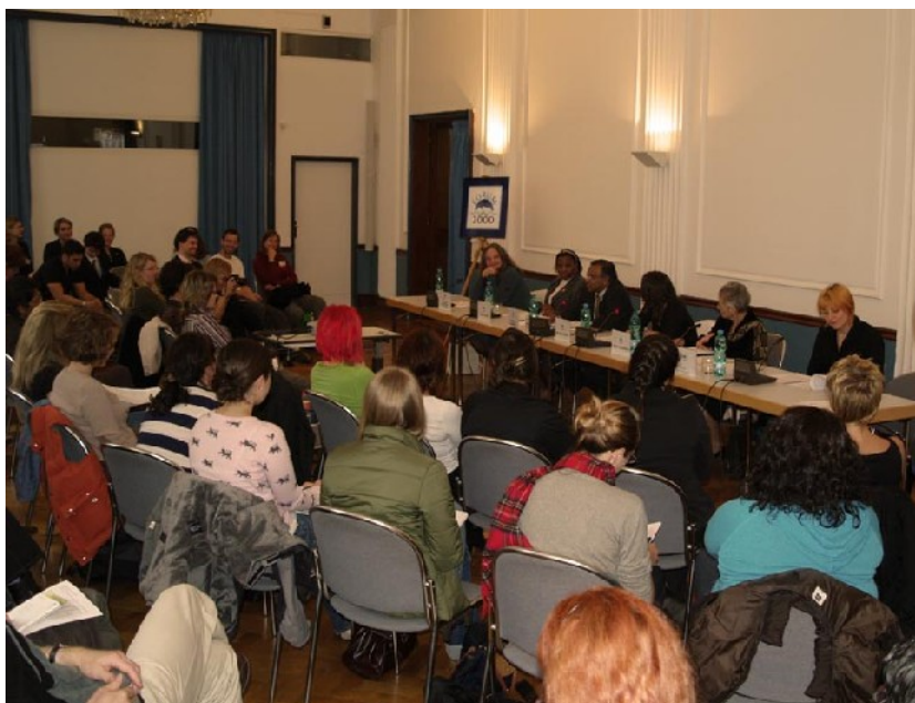
Fórum 2000 "Role žen v mírových procesech"

Ve spolupráci s Forem 2000 jsme v říjnu 2007 v Goethe institutu uspořádaly kulatý stůl s významnými osobnostmi, které mají úzký vztah k ženám a mírovému procesu. Nechyběly mírové aktivistky z Afriky, kandidát na tajemníka OSN, ani jihoafrická ambasadorka a genderová odbornice. Diskutující se shodli na tom, že přínos žen v mírovém a stabilizačním procesu celého světa je neoddiskutovatelný. Právě proto je třeba umožnit ženám podílet se na rozhodovacích a mírových procesech v zájmu blahobytu a prosperity celého světa.