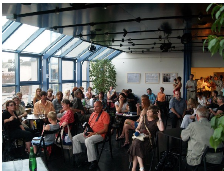
Vernisáž a vyhlášení výsledků "Strana otevřená ženám"

Stejně jako v roce 2006, i v roce 2007 se česká veřejnost díky výzkumům veřejného mínění , které Fórum 50 % zadalo, dozvěděla, jak se v Česku nahlíží na zastoupení žen v politice, na šance žen uplatnit se v rozhodovacích pozicích nebo na kvóty. Výzkumy ukázaly, že se (snad i díky aktivitám Fóra 50 %) názory na potřebnost žen v politice nebo podporu pozitivních akcí postupně zvyšují.