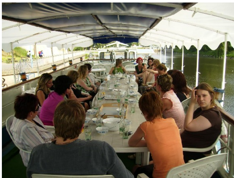
Setkání političek v Poděbradech

Aktivity: V rámci projektu byly zpracovány kandidátky a výsledky komunálních voleb 2006 z pohledu genderu . Součástí projektu byly i prezentace výše uvedených analýz v médiích, jejichž cílem byla osvěta veřejnosti . Mimo jiné se jednalo o spolupráci při vytváření pořadu Na bělidle, ČRo 6 . V lednu a v květnu se konala dvě větší setkání /semináře političek ze statutárních měst v Praze, resp. v Poděbradech. V první polovině roku bylo vyškoleny ve speciálních kursech pro političky téměř 20 žen , ze kterých se staly kompetentnější a uvědomělejší politické osobnosti.