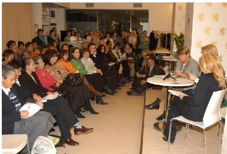
1. Symposium České prezidentky

Za velkého zájmu veřejnosti se 18. 9. 2007 sešly významné ženské osobnosti na Symposiumu České prezidentky, aby diskutovaly nad tím, co je dobrého pro naši zemi a kam by měla směřovat. Přední ženské osobnosti hovořily o svých zkušenostech, vizích a představách budoucnosti ČR. Historicky první Symposium České prezidentky bylo částečně financováno z prostředků Global Fund for Women a Open Society Fund.